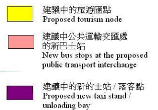
Location of Proposed Tourism Node