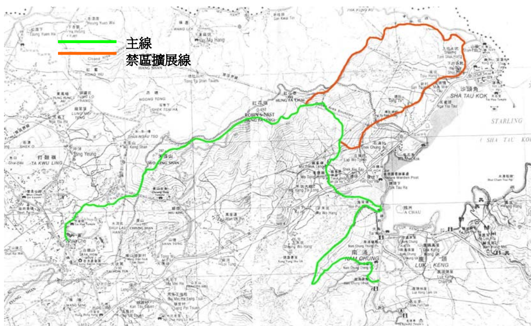
圖 4 邊界區域徑