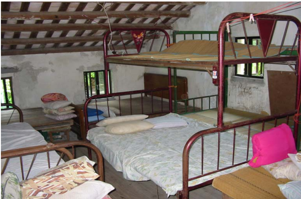
東平洲 - 廉價的住宿設備

260 除了沿汀角路的設施外包括位於大尾篤周圍的餐廳外，研究地區只有非正式、未經管制、未獲發牌的兼職時間經營旅遊業，並且質素一般。這種情況在住宿業中也存在，這種健全但非正式的住宿在很多偏遠地區都存在。此外，在一些食品和活動經營商中也存在類似情況，尤其在一些偏遠地區。一些前居民在週末返回村落，售買商品給遊客。