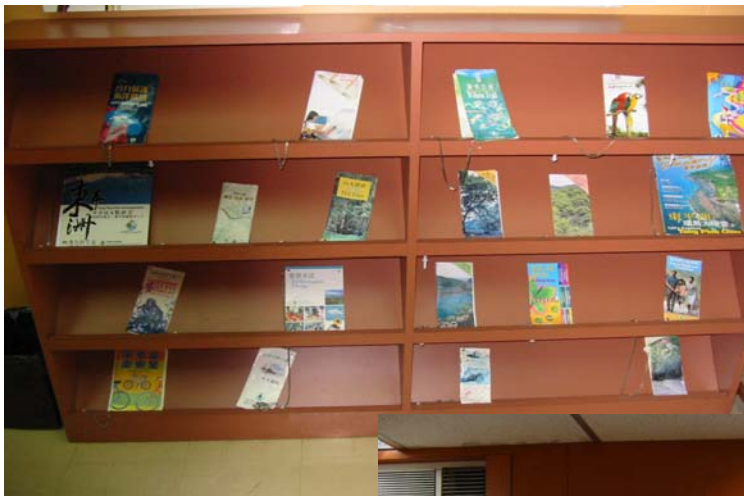
所提供的資料屬非賣品

通過編寫綜合系列的指南書籍、遊蹤、鄉村歷史、地區博物館及在村落和沿著步行徑描述和解釋有趣的特別項目。除非負責自然旅遊的導遊對野外生活非常有體驗，否則他們需要經過特別培訓。