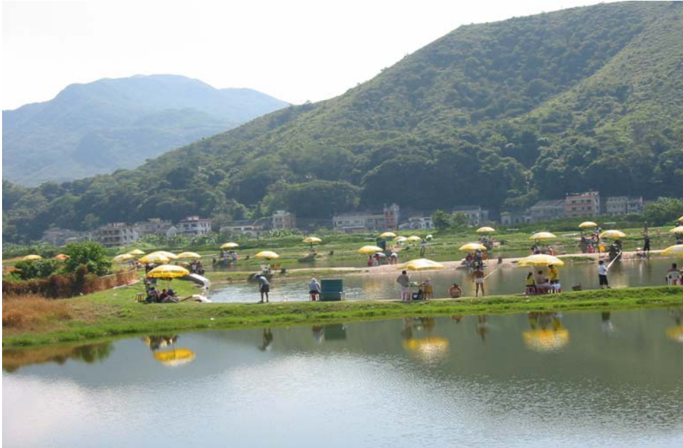
鹿頸 - 康樂釣魚場

183 可以鹿頸及其四周作為文化旅遊活動的焦點。它可以作為文化旅遊的焦點，著重於區內有形及無形文化的價值。另外，可以發展一些徒步旅行來串聯起荒廢的村落