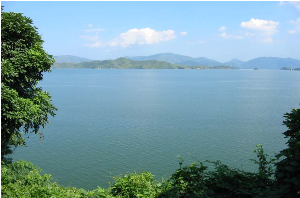
船灣淡水湖是一有吸引力的康樂資源