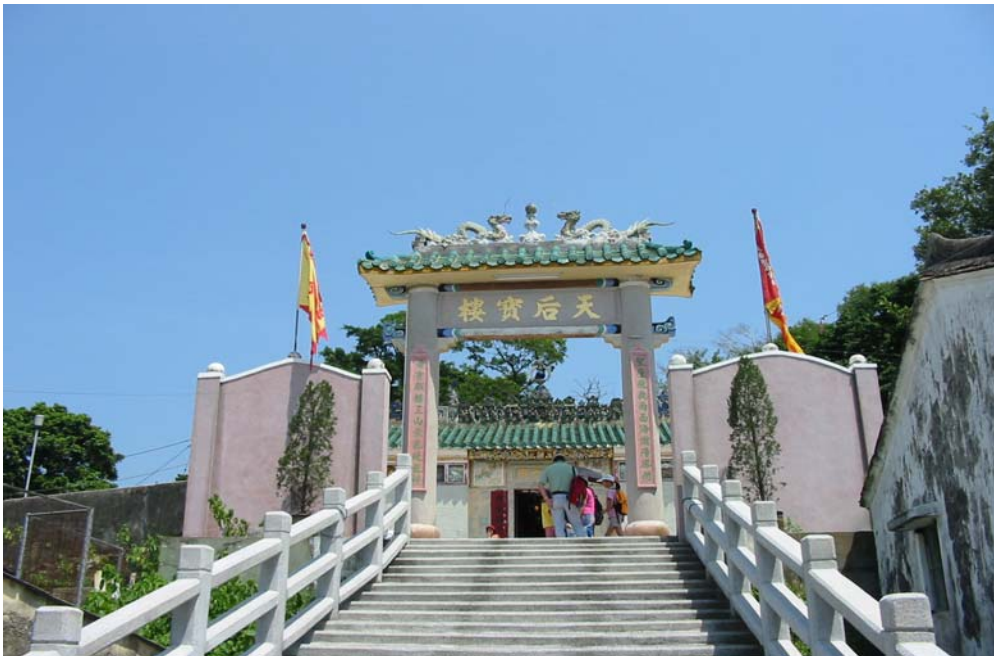
塔門 - 天后廟