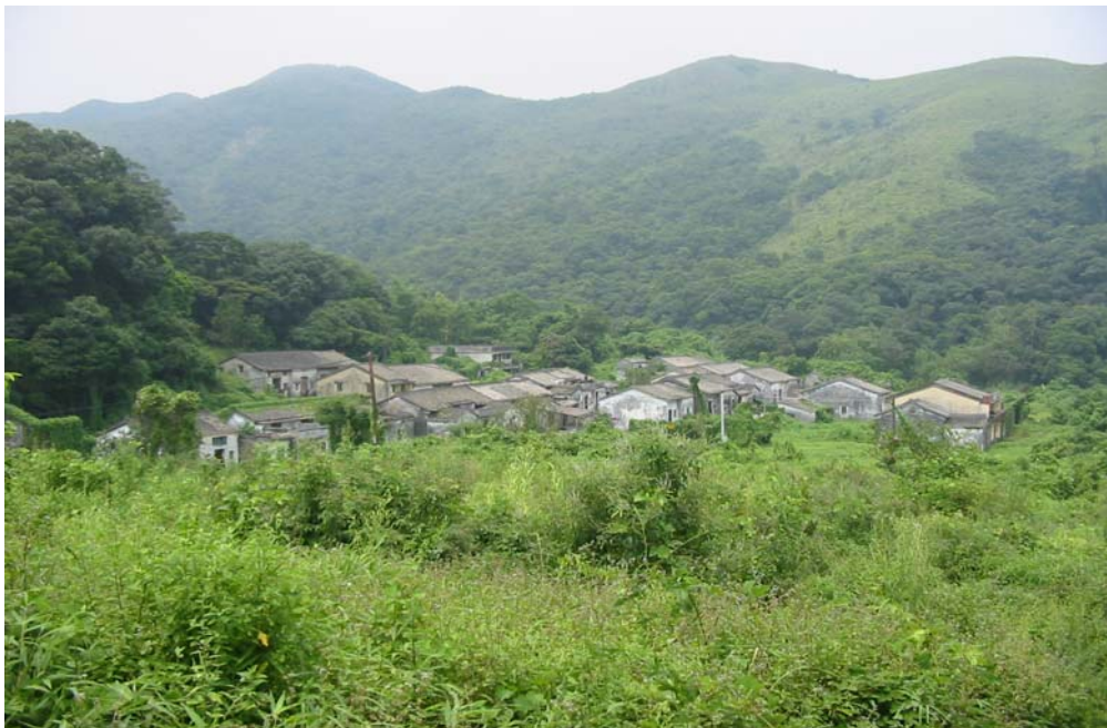
沙螺洞 - 已荒廢的村落