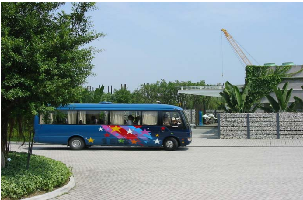
香港濕地公園的入口

205 當香港濕地公園完成興建及投入運作時，旅遊業的潛力會得以提高。除此之外，利用單車徑及步行徑網絡把米埔及濕地公園連起來，可以創造新的市場機會。這個建議須要興建一條橋，橫跨山貝河(元朗)並連接尖鼻咀(近污水處理廠及工業村)與南生圍。