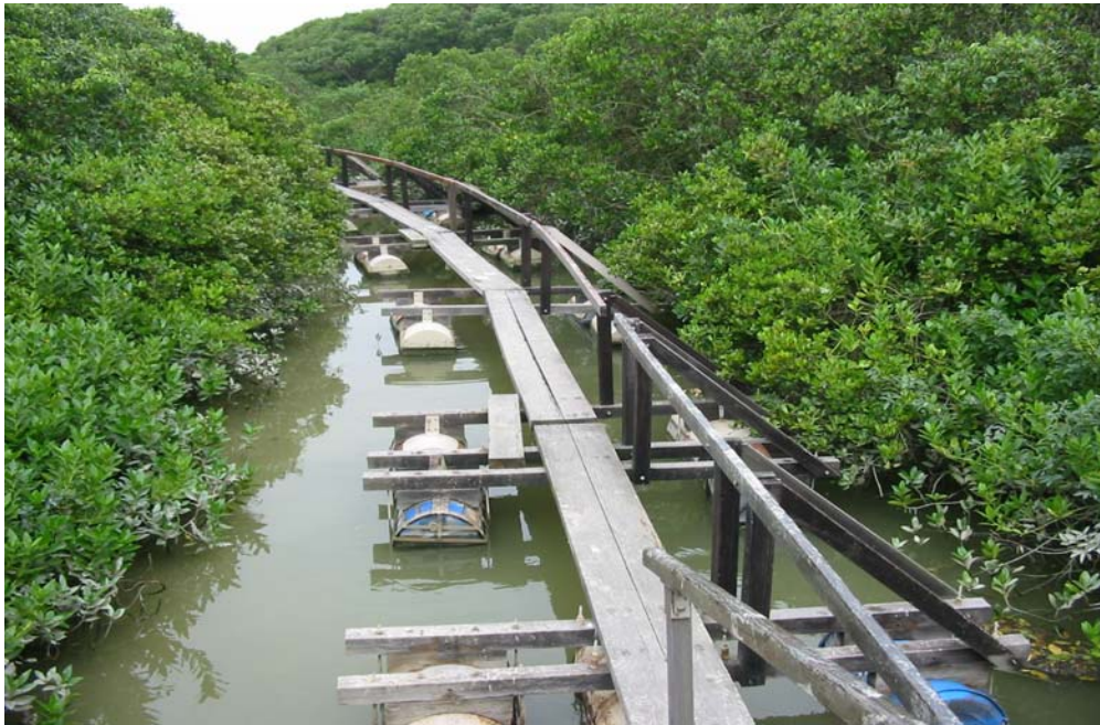
米埔 - 到達后海灣觀鳥的通道

192 邊境禁區內的地方大致完整，也代表著香港剩餘的濕地，包括潮間泥灘、紅樹林、傳統蝦塘(基圍)、海草床和魚塘。