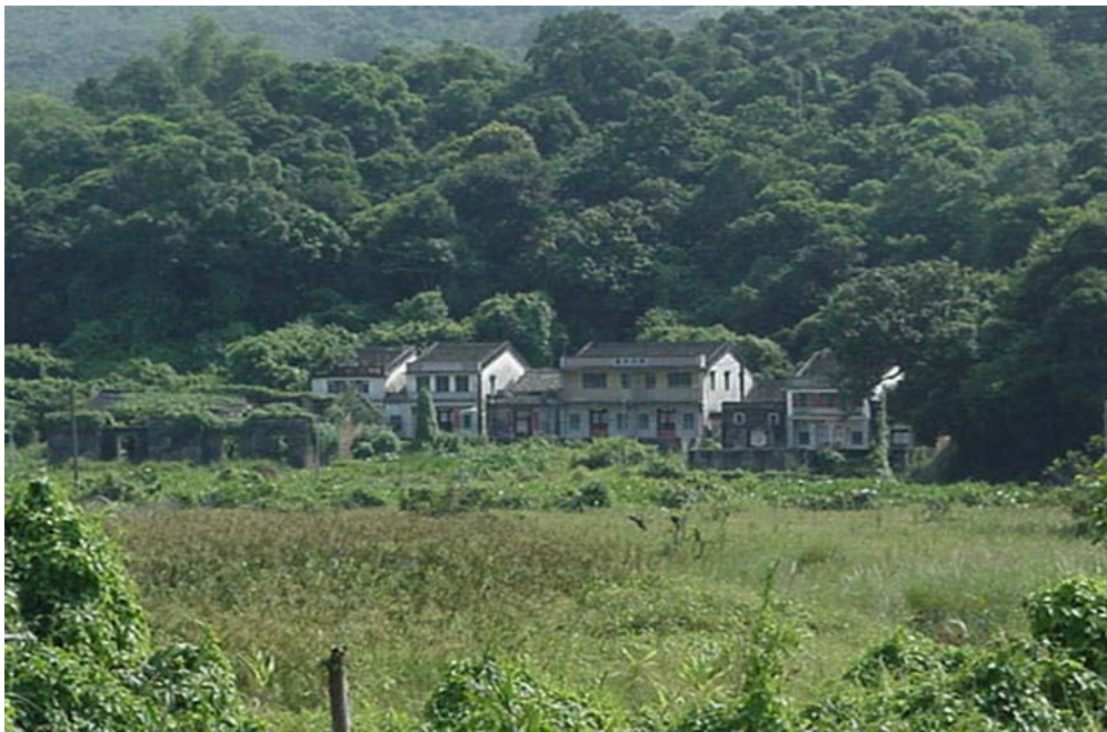
從已荒廢田地遠望鹿頸的一角