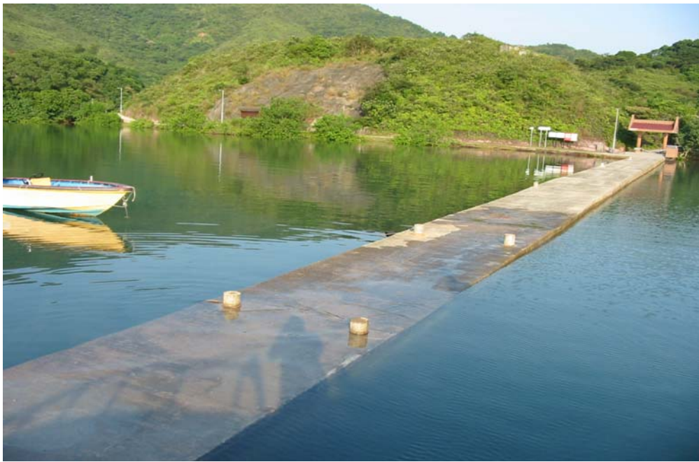
印洲塘 - 碼頭