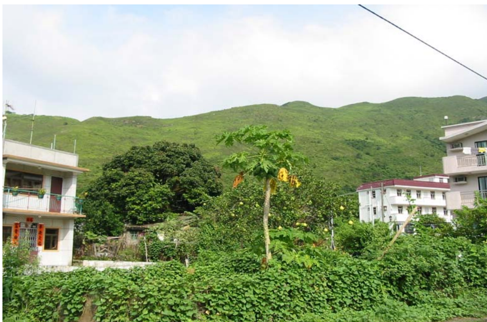
邊境禁區內的村落