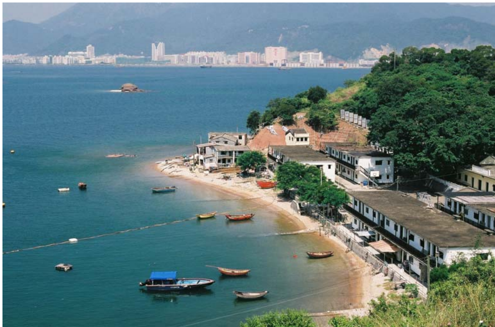
鄰近高度發展的中國大陸，破壞了鴨洲的寧靜