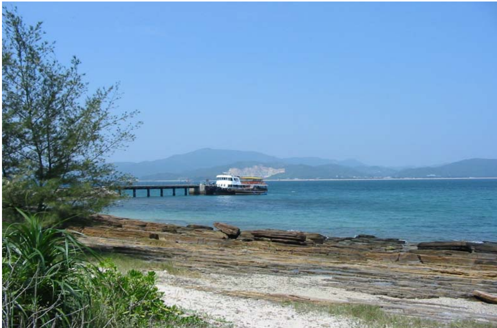
東平洲 - 碼頭