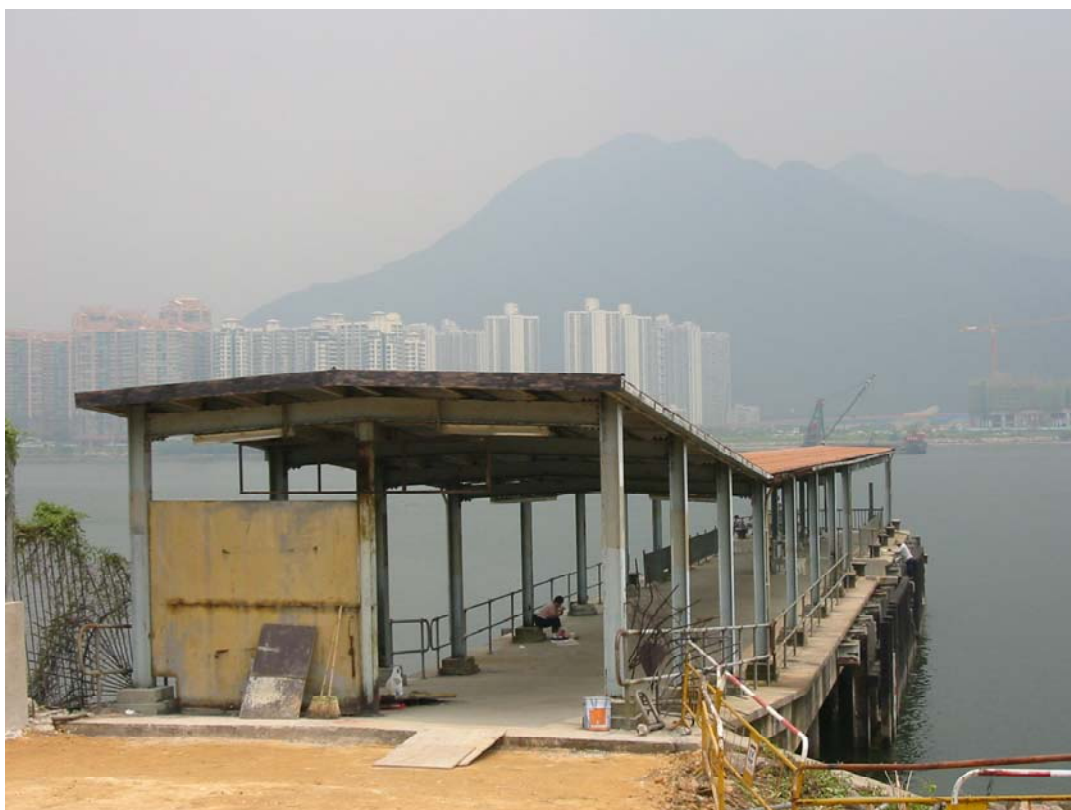
馬料水 - 碼頭