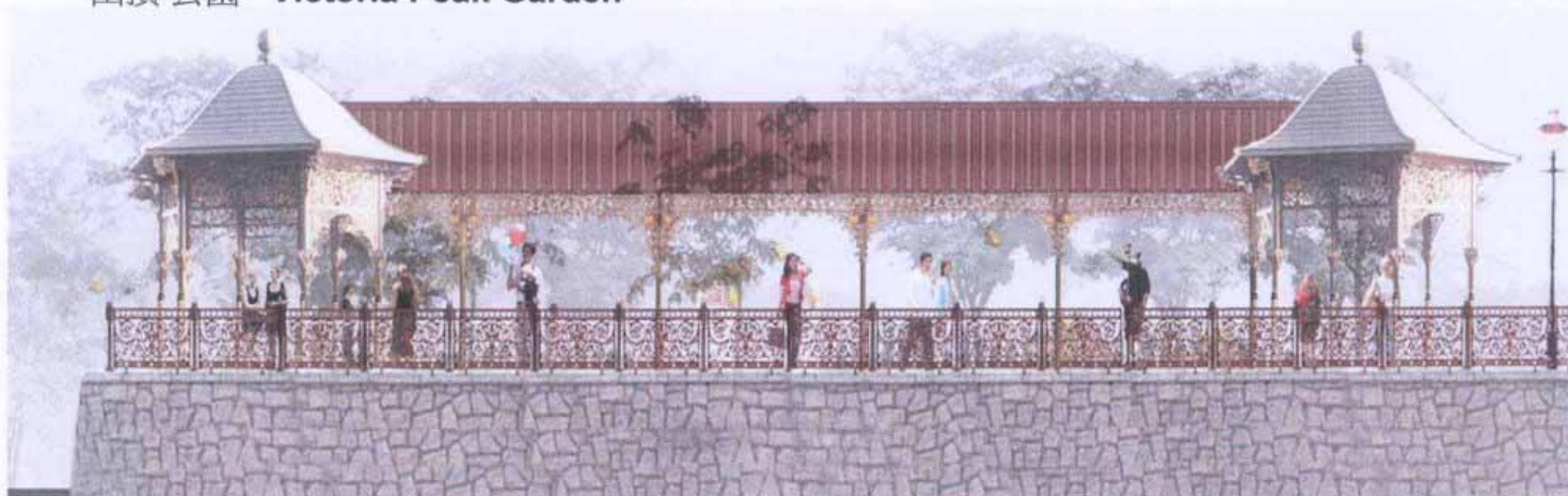
維多利亞式的花園