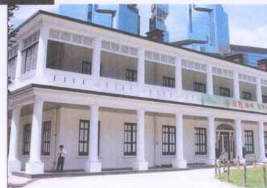
維多利亞式的建築物 - 茶具文物館 Victorian style building – Flagstaff House Museum of Tea Ware