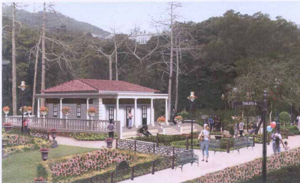
柯士甸山遊樂場的建築物及設施 Structure and Street Furniture in Mount Austin Playground