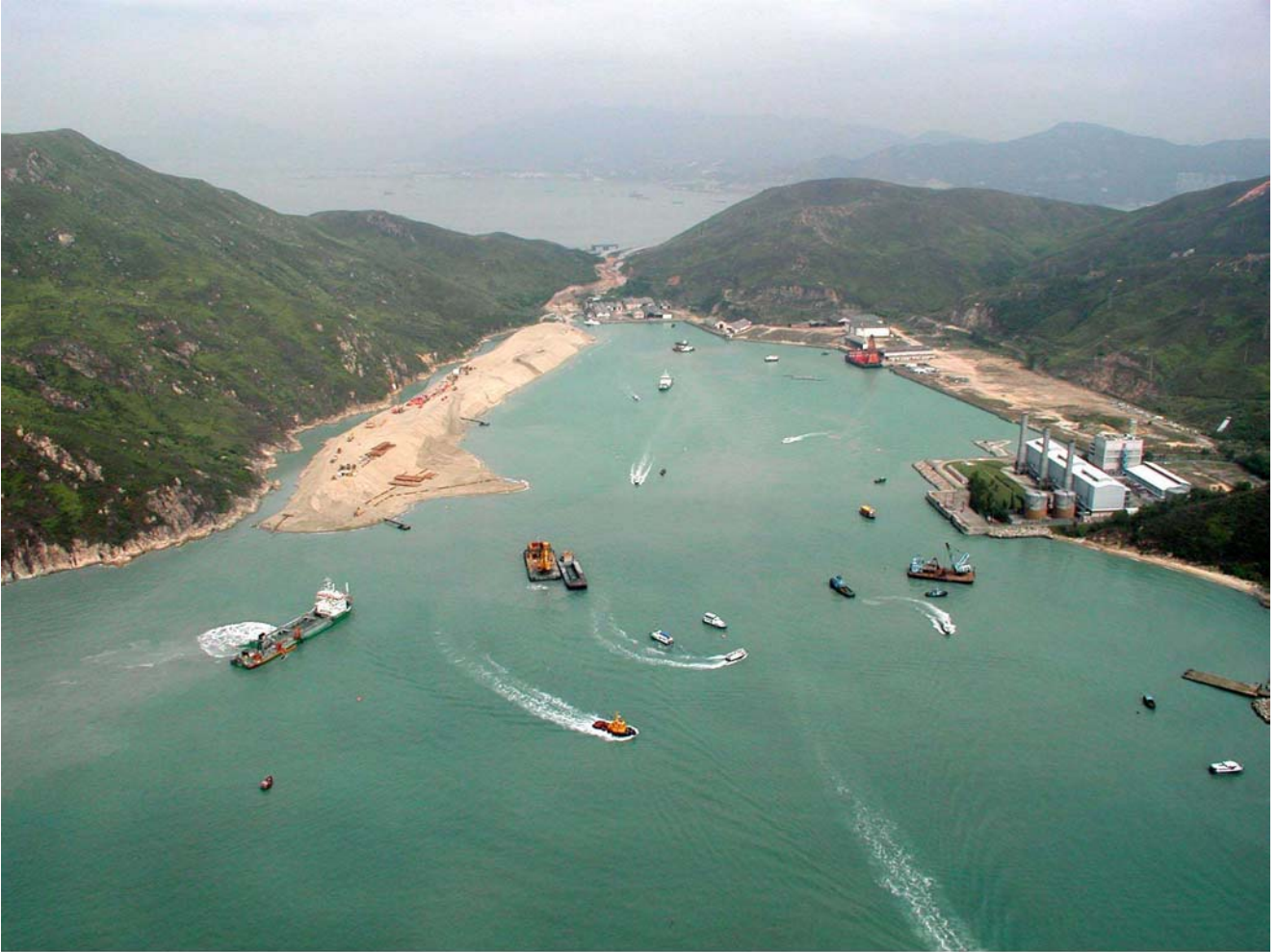
Penny's Bay Reclamation Stage 1 Works (Progress at end March, 2001)