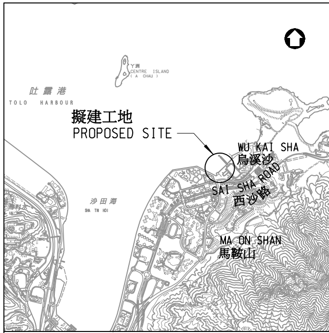
位置圖 LOCATION PLAN 1 : 50 000