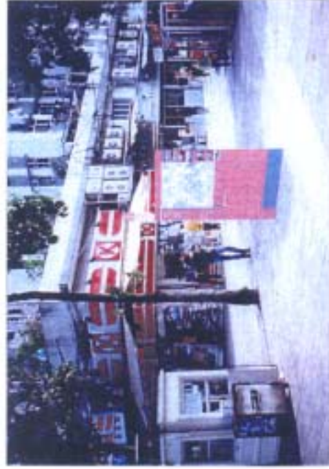
圖中方向指示牌僅表達其建議之安裝位置，指示牌上之方向紙作示範用。 Directional Signage shown on the photo is solely for the indication of location on site. The orientation on the sign is only for illustrative purpose.