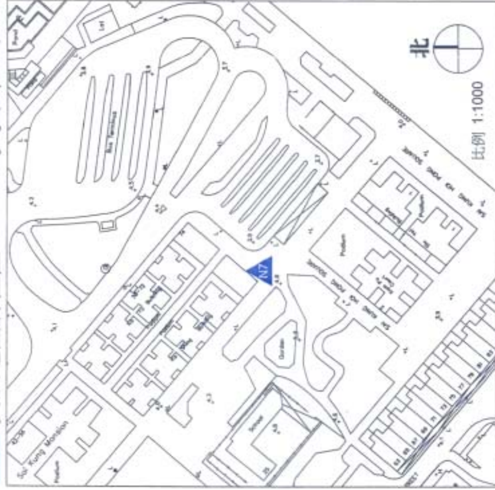
N7 資訊地圖牌位置 Information Signage (Mapboard) Location