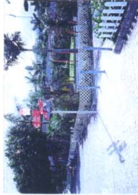
圖中方向指示牌僅供其建議之安裝位置，指示牌上之方向僅作示範用。 Directional Signage shown on the photo is solely for the indication of location on site. The orientation on the sign is only for illustrative purpose.