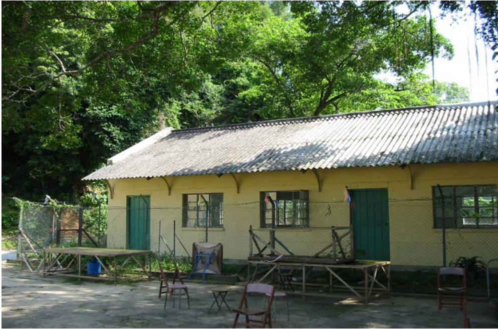
荔枝窩 - 沒被使用的學校