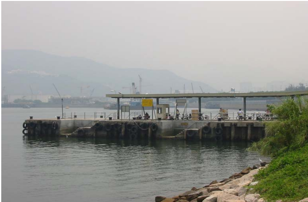
马料水 - 现存的码头只在周日使用。并没有饮食及资讯设施提供。

根据该地区的特点，大埔(和当九广铁路延续工程完成后的马鞍山)应该被定为南部的通道；而沙头角应被定为东北的通道。大埔将很大程度上服务吐露港，赤门海峡，海下湾及塔门岛，同时也是进入郊野公园的南部通道。沙头角将作为北面的通道往郊野公园；它最主要是海岸公园和离岛的通道。