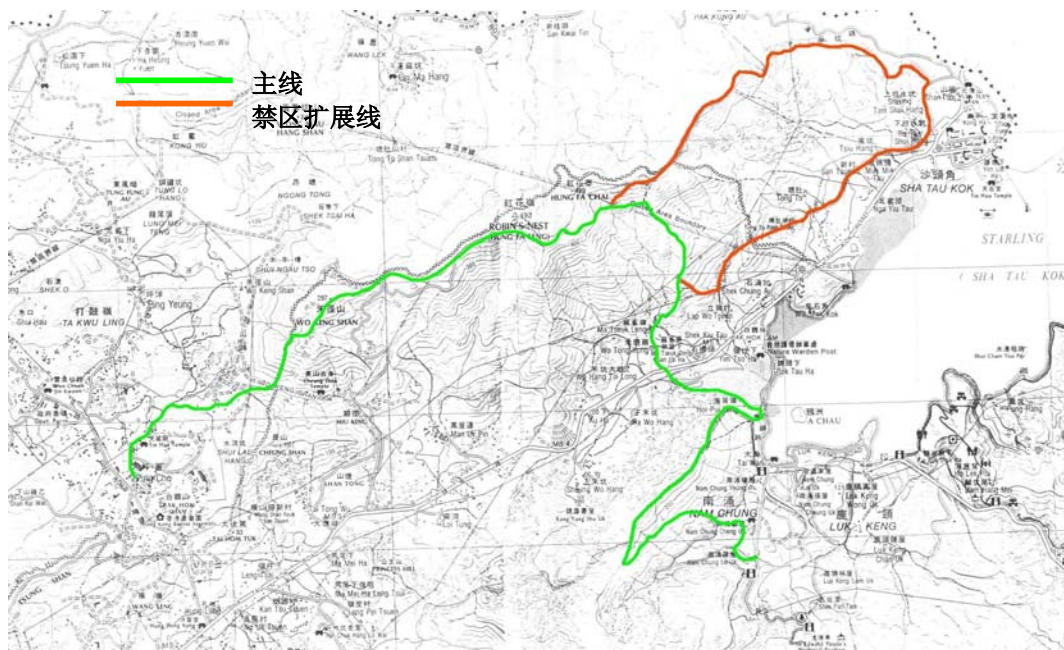
图 4 边界区域径