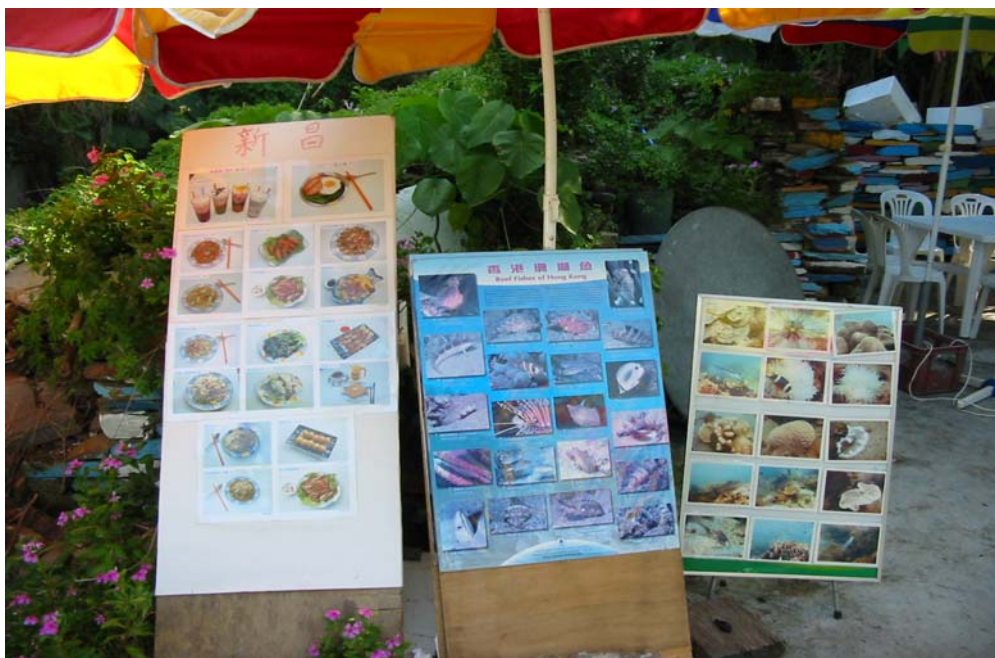
东平洲 - 摊档提供饮食服务及有关海洋的资料

发展该地区成为国际旅游点需要建立永久的旅游业。这就需要引入非当地居民投资旅游业，并在其中担任管理职位。