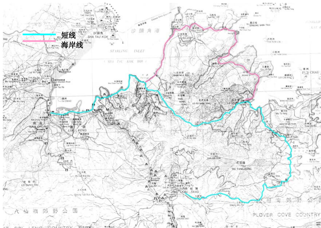
图 6 沿海村落径

284 需要设立另外的露营区来鼓励步行者和背囊旅游者在该地区逗留。这些可位于宁静的景点，或沿着现有或经改良的步行径。可行的地区包括近凤坑或南涌来服务沿海村落径和卫亦信径的末端，和在乌蛟腾服务船湾循环，并连接沿海村落径。