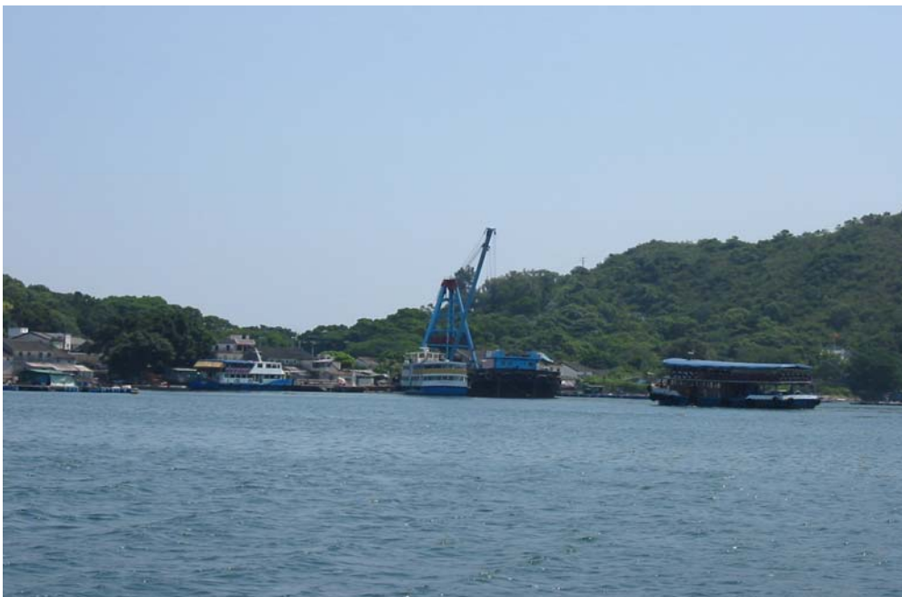
吉澳 - 码头

如果有需要，应该扩大或扩展吉澳和塔门的码头（获海事处知会，吉澳和塔门的码头将会改建）。