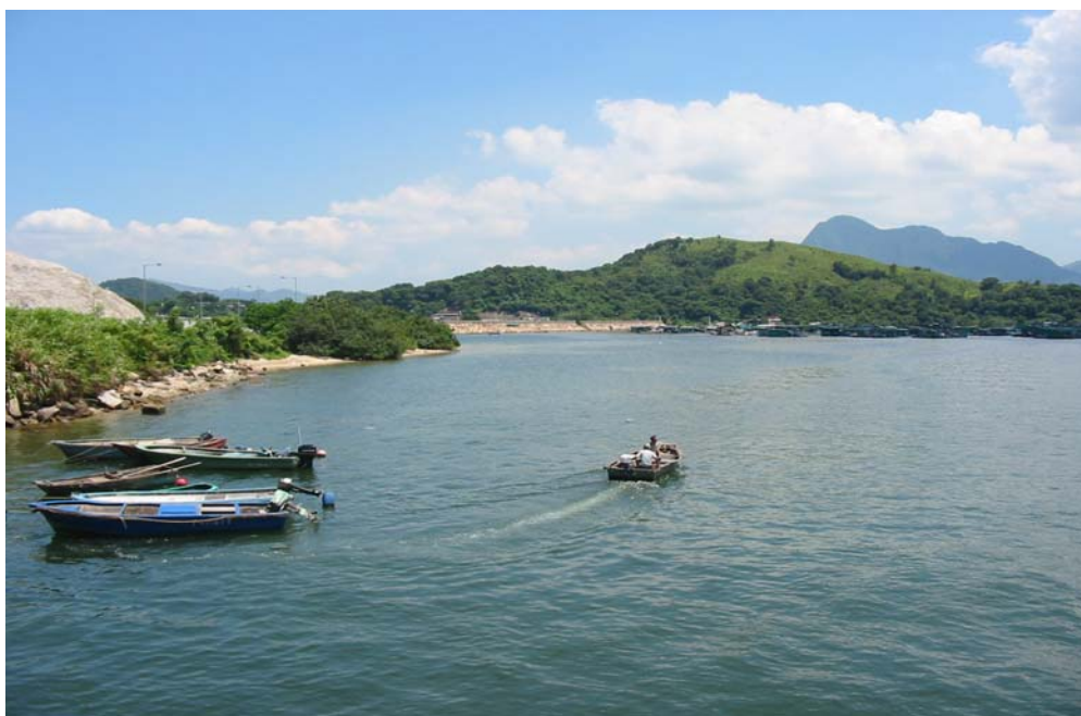
吐露港内部 – 盐田仔