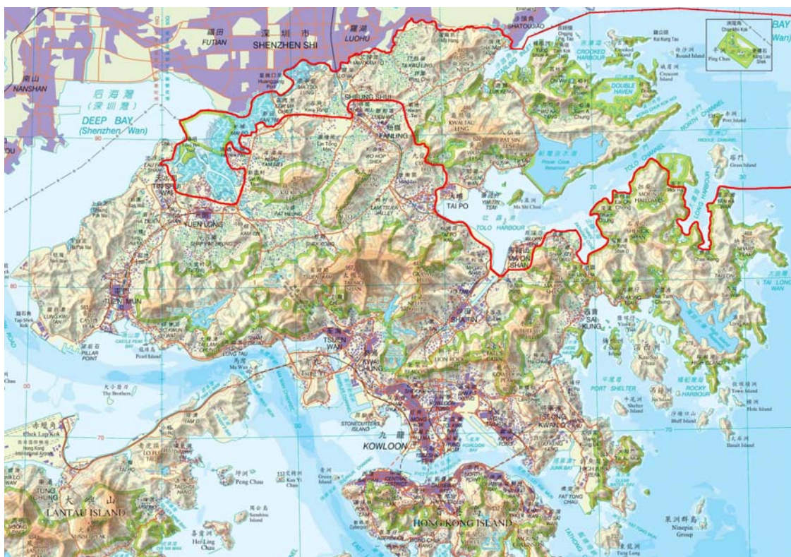
图 2 研究范围